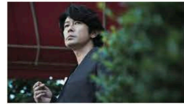
ホテルキヨシ名古屋第2