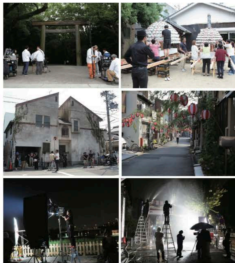
撮影には、『あつた宮宿会』の若手経営者の皆さんを始め、 地元の皆さんに多くのご協力をいただきました。

ロケ地 マップ製作 | 映画「名も無い日」を活用した観光プロモーション実行委員会 ジジックススタジオ (公財)名古屋観光コンベンションビューロー 名古屋市