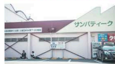
サンパティークヒビノ